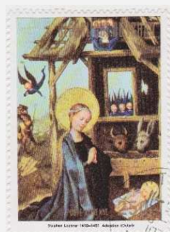
Les timbres dits de « sujets religieux »