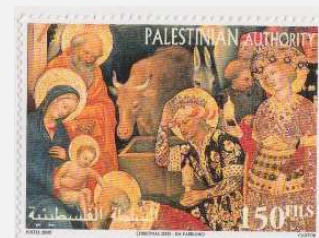
Les mages à la crèche