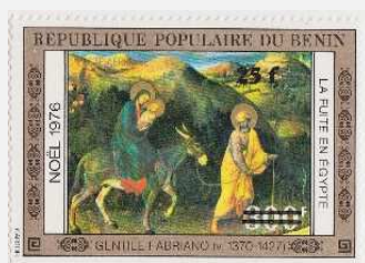
La fuite en Égypte