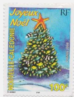
Les décorations du temps de Noël : Sapins, bougies, santons... etc.