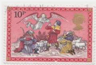
L'annonce aux bergers