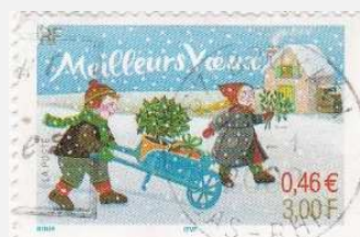
Les timbres de « meilleurs vœux » en y ajoutant ceux de « bonne année »

En complétant mon classement, je pense que je vais y ajouter une 6 ème catégorie, qui regrouperait les timbres émis suite à des concours de dessins d'enfants sur le thème de Noël : il y en a dans tous les styles, suivant l'âge et le pays d'origine des enfants !