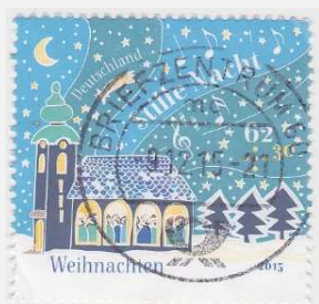
Les paysages d'hiver