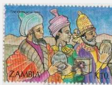
Les mages venus d'orient