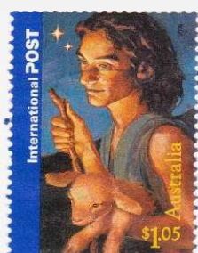
Les bergers à la crèche.